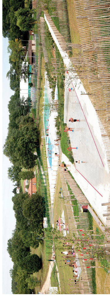
Théâtre d'eau, Fumel, Log architectes, Atelier Roberta paysagistes

Le maître d'ouvrage doit constituer un jury composé de personnes indépendantes des participants au concours dont au moins un tiers de professionnels disposant des qualifications demandées aux candidats.