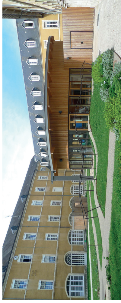
Plateau de rééducation, Montfaucon, Philippe Bergès-phBa architectes

Conseil : Pour ce faire, vous pouvez vous rapprocher de votre CAUE ou d'un conseil extérieur (AMO, Programmiste, etc.).