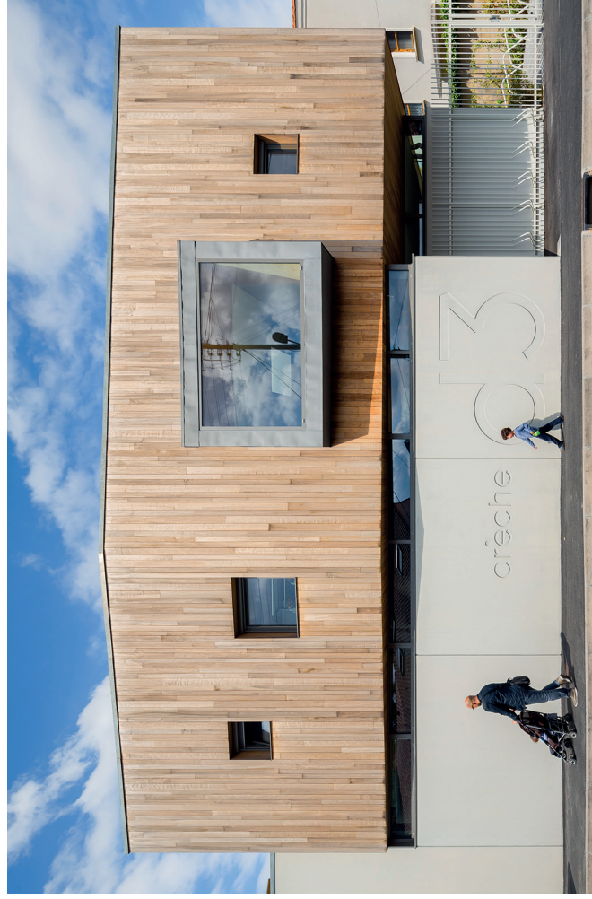
Centre multi-accueil Détruis, Bordeaux Caudéran, Gayet-Roger Architectes, Collectif Pepitomcorazon

Le choix de la procédure appropriée et correctement menée garantit l'efficacité de la commande et la bonne utilisation des deniers publics.