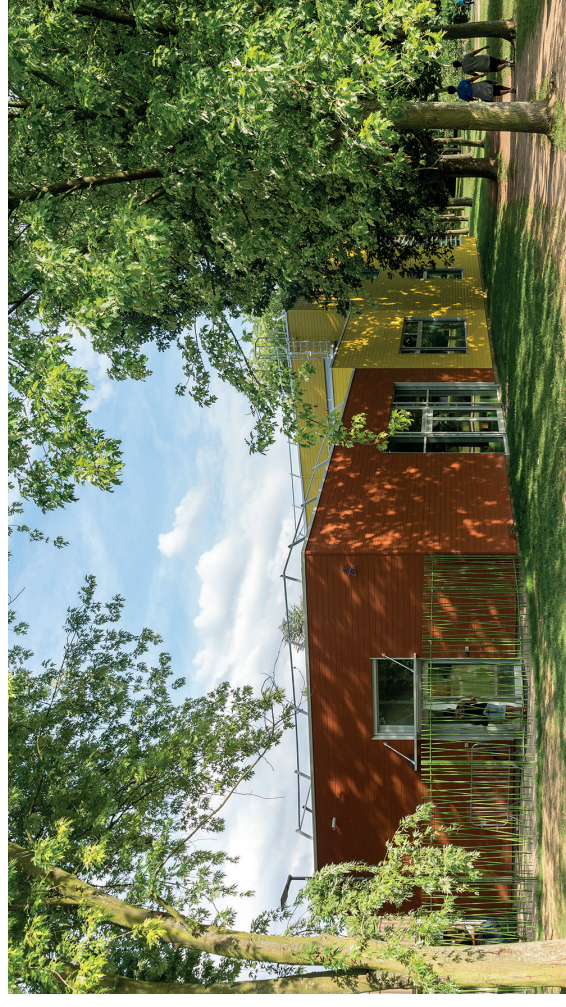
Centre de loisirs Pablo Neruda, Chevilly-Larue, Sylviane Saget architecte

3 Sélectionnez les candidatures en fonction des critères indiqués dans l'avis de marché.